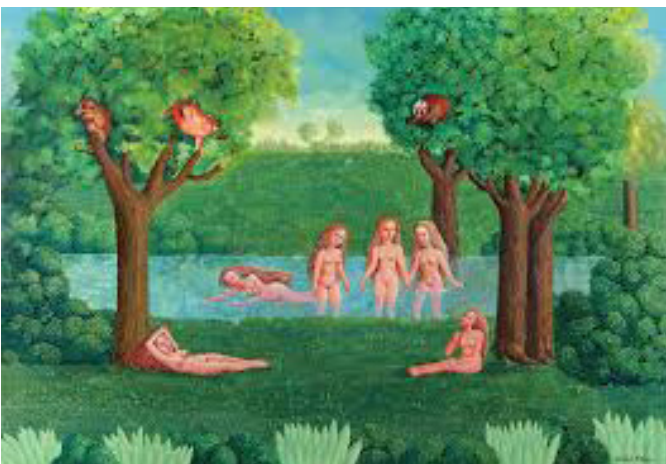
Isabel Villar, Seis muchachas en el río , 2017