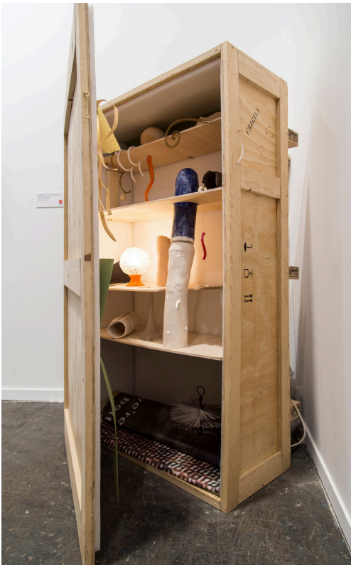
Cristina Mejías, We're stepping on the bottom of the sea , 2019