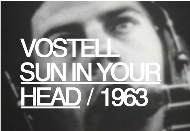
Wolf Vostel Dé-collage video films, 1963-1971