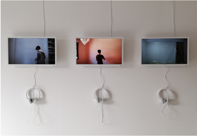
Olalla Gómez, CV en blanco , 2019