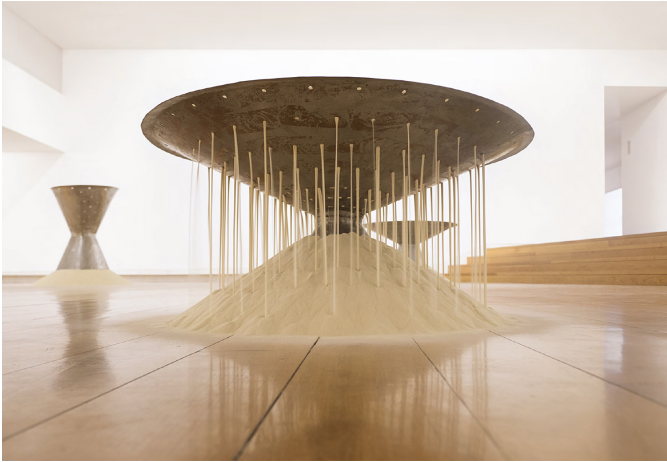
Eva Lootz, Gran cascada , 1996