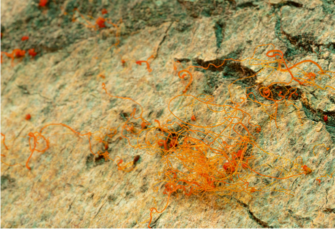
Trémula, 2020. Hongo crysosperma en árbol rescatado (detalle).