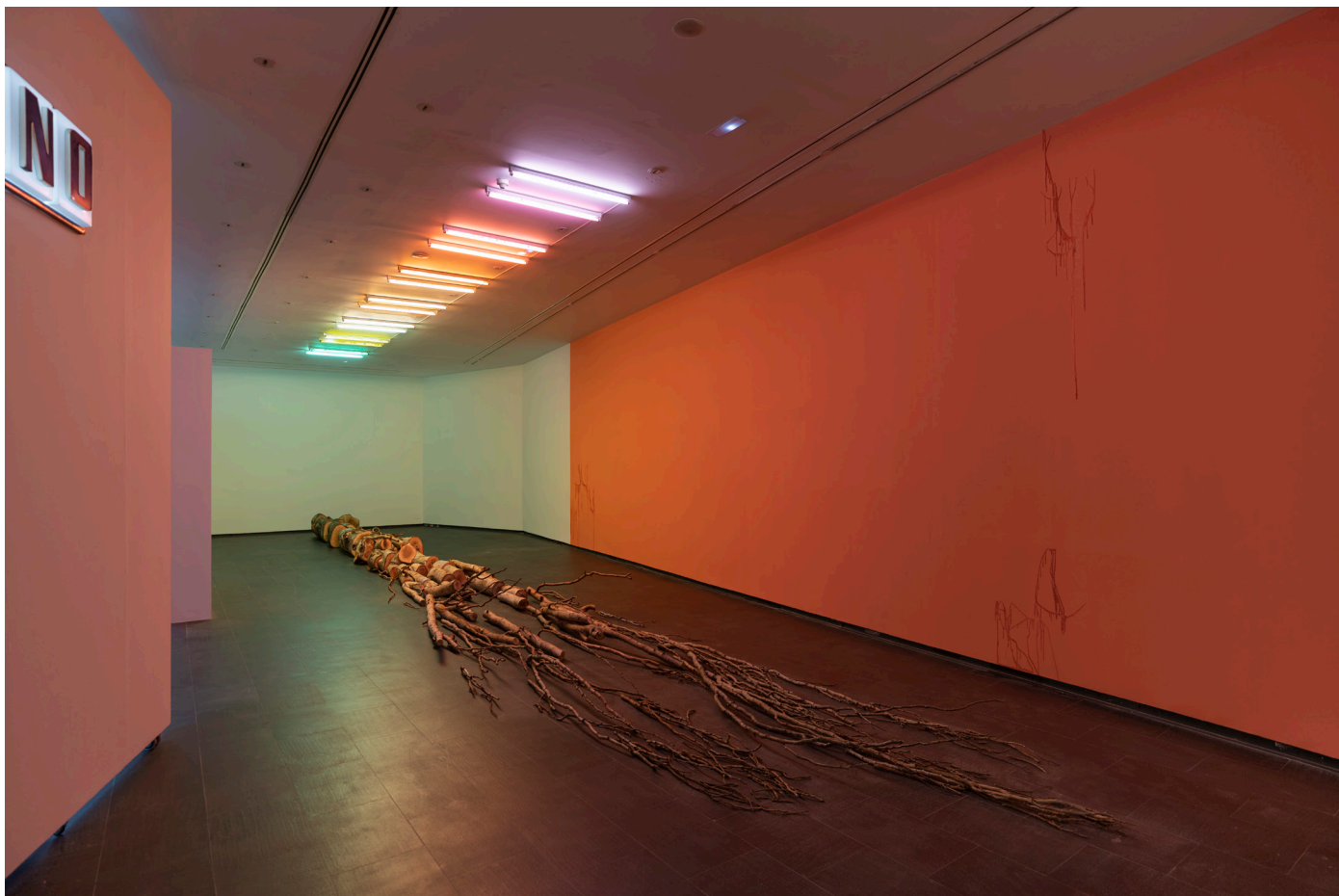
Vista de la exposición.