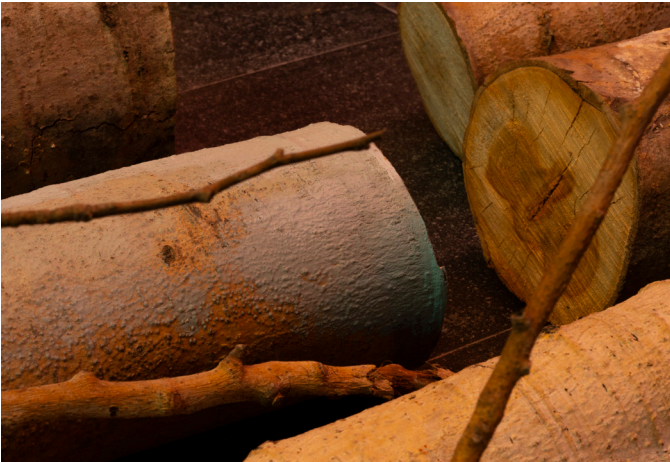
Trémula, 2020. Maquillaje sobre árbol rescatado.