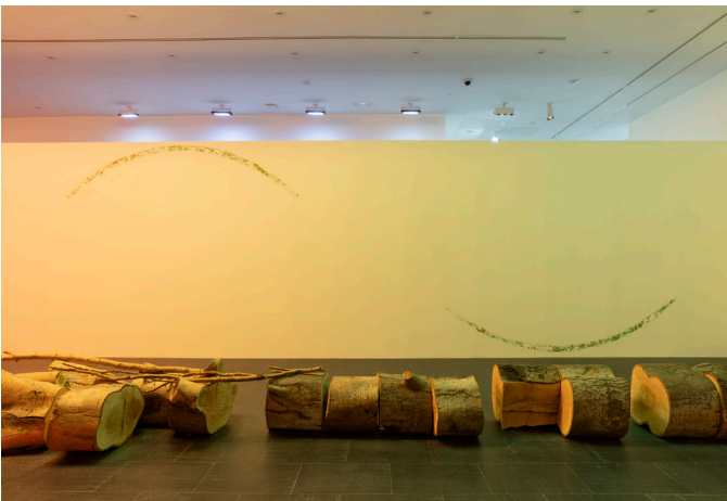
Trémula, 2020. Vista de la exposición VI.