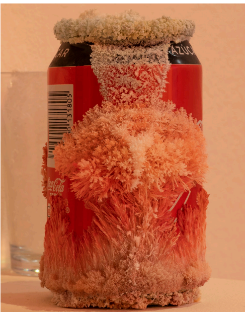
Trémula, 2020. Ácido salicílico, corteza de chopo diluida, segueta, latas, vasos, botella, aspirina (detalle).