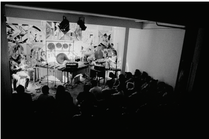
Orquesta de las nubes. Concierto. Espacio P. Madrid, 1985.