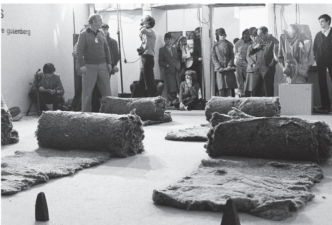
Presencias. ARCO'82. Grupo Corps. Performance. Madrid, 1982.