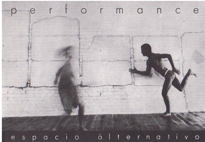
Tarjeta utilizada para la difusión de las actividades de Espacio P.