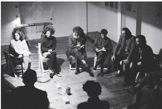
Acercamiento a Michelangelo Pistoletto. Espacio P. Madrid, 1983.