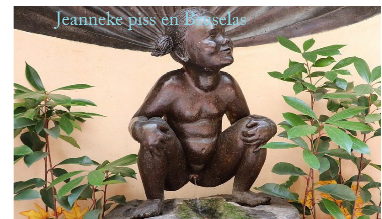
Jeanneke piss en Bruselas