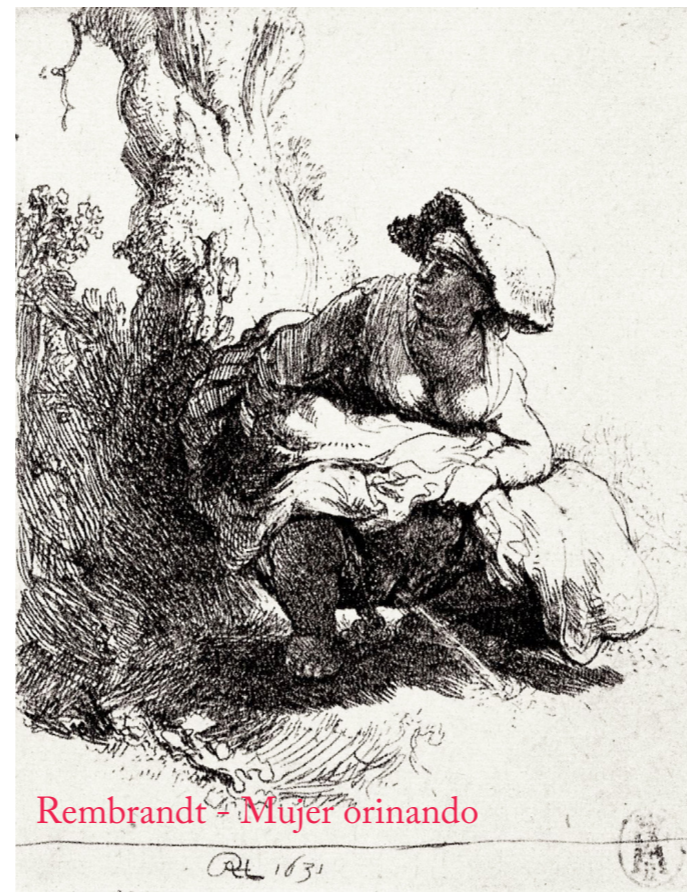
Rembrandt - Mujer orinando