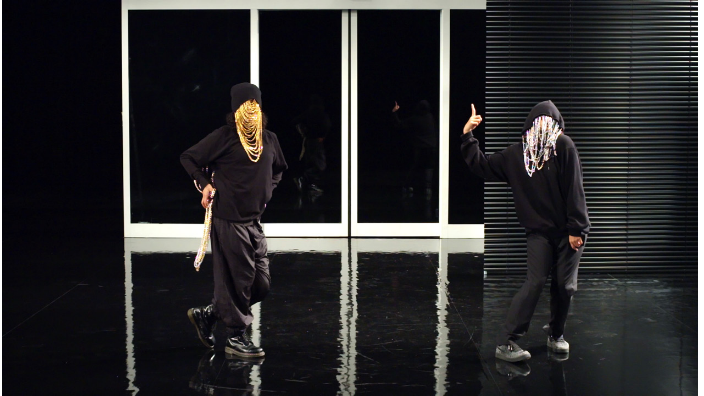
Imagen: (No) Time , Pauline Boudry / Renate Lorenz. Instalación con HD y tres persianas, 2020.