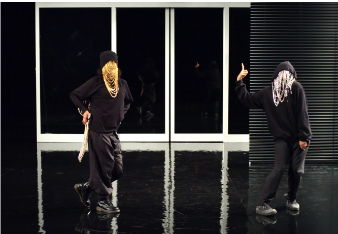
(No) Time , Pauline Boudry / Renate Lorenz, still. Instalación con HD y tres persianas, 2020.