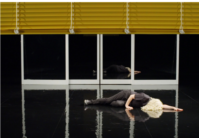
(No) Time , Pauline Boudry / Renate Lorenz, still. Instalación con HD y tres persianas, 2020.