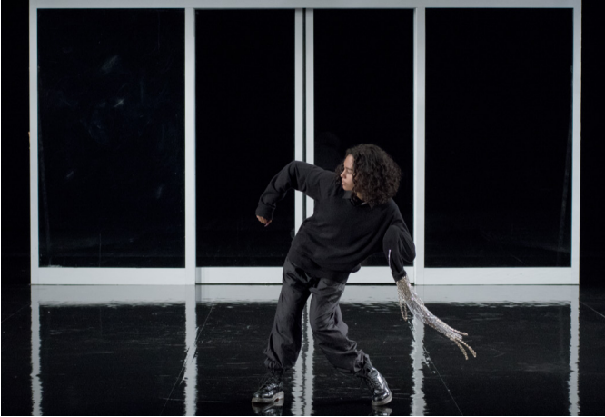
(No) Time , Pauline Boudry / Renate Lorenz, still. Instalación con HD y tres persianas, 2020.