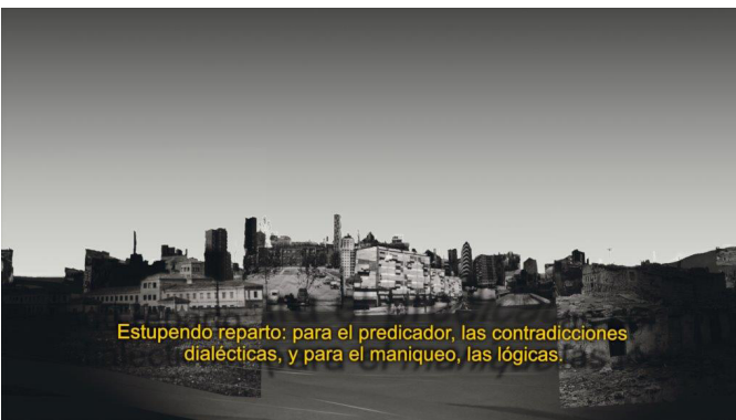
Paloma Polo El predicador y el maniqueo Vídeo, 2019