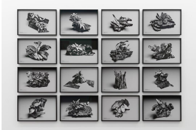
Paloma Polo A fleeting moment of dissidence becomes fossilised and lifeless after the moment has passed Fotografía Cortesía de la artista