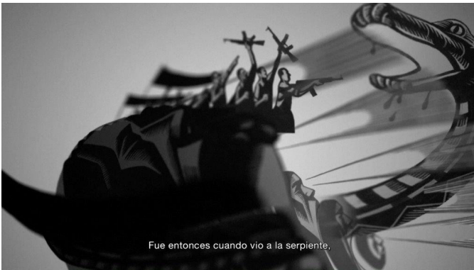
Paloma Polo What is Thought in the Thought of People Película, 2015