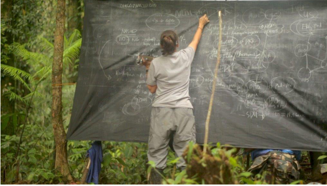
Paloma Polo El Barro de la Revolución Película, 2019