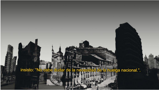
Paloma Polo El predicador y el maniqueo VÍdeo, 2019