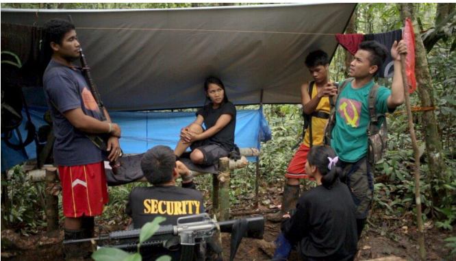
Paloma Polo El Barro de la Revolución Película, 2019