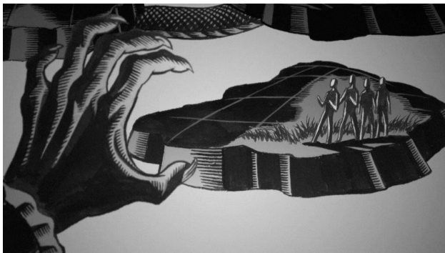
Paloma Polo What is Thought in the Thought of People Película, 2015