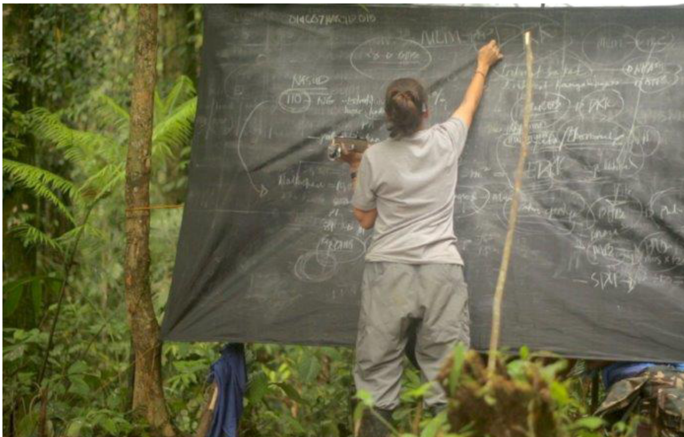
Imagen: Paloma Polo. Fotograma de la película El Barro de la Revolución , 2019.