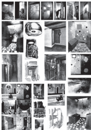
Pedro G. Romero Archivo F.X. Hoja de Libre Circulación n° 8