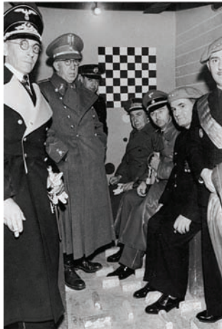
Pedro G. Romero Archivo F.X. Entrada: Carl Schmitt. Hoja de Libre Circulación.