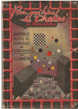
Pedro G. Romero Archivo F.X. Entrada: Dècor. R.L. Chacón, Por qué hice las "chekas" de Barcelona. Laurencic ante el consejo de guerra, Solidaridad Nacional, 1939.