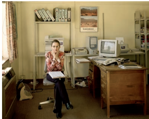
David Goldblatt, Serie Cargos Municipales, 2004.