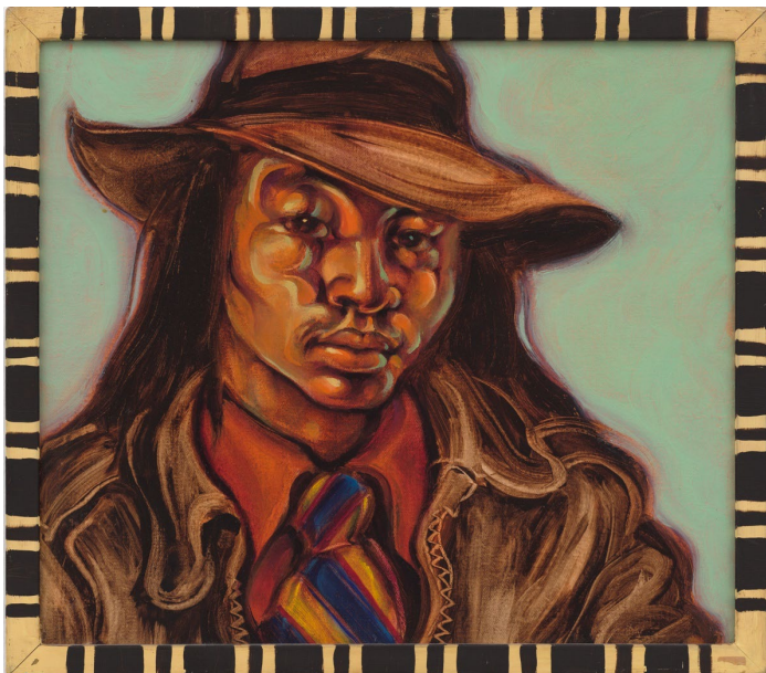
Sin título, Autorretrato, ca. 1974–1975. Acrílico sobre lienzo y marco pintado a mano.