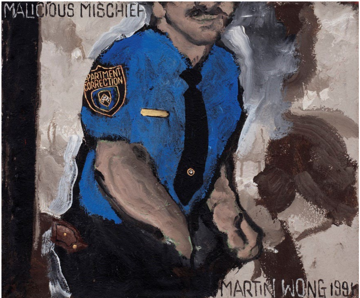
Imagen: Martin Wong, Malicious Mischief , 1991. Cortesía de The Martin Wong Foundation y P.P.O.W Gallery, NY. © Martin Wong.