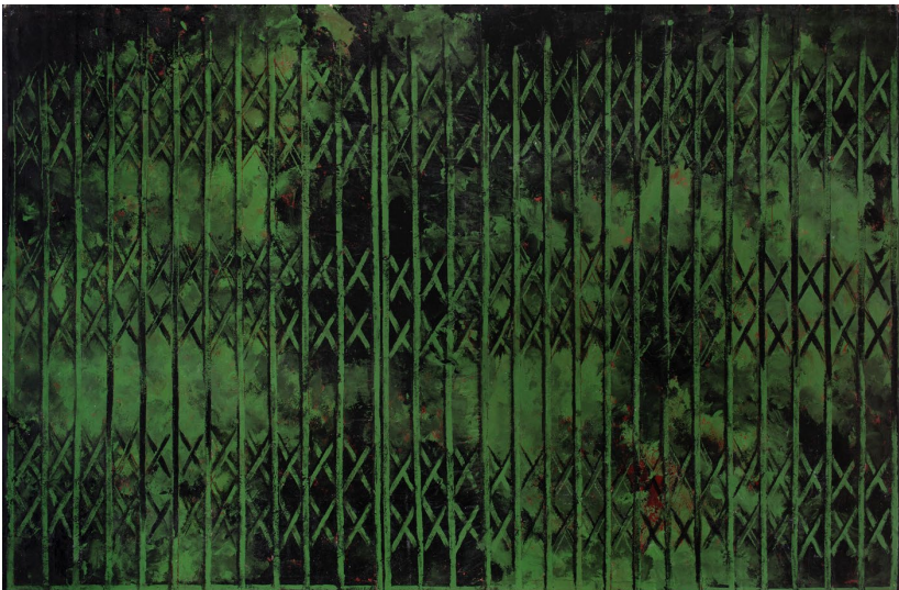
Sin título, escaparate verde , 1985 Acrílico sobre lienzo