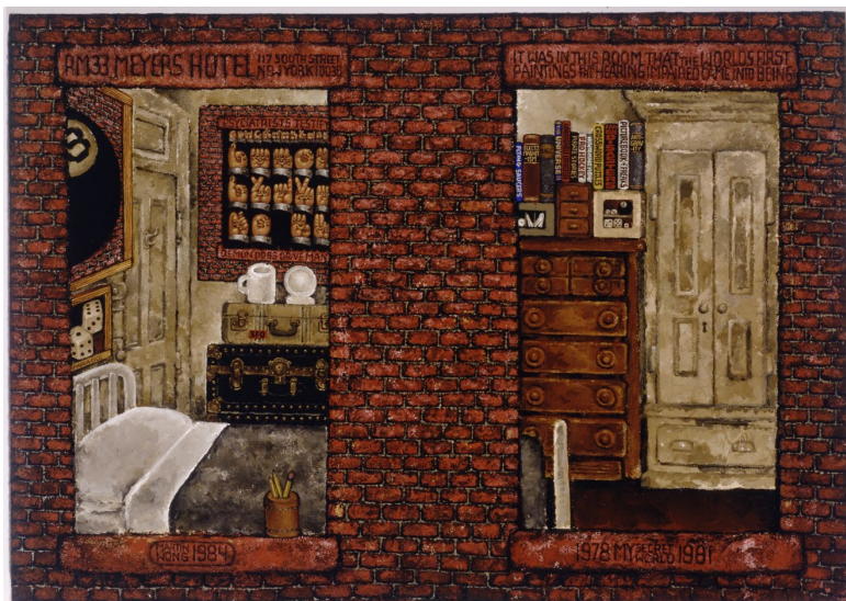
Mi mundo secreto 1978–1981, 1984 Acrílico sobre lienzo Colección KAWS