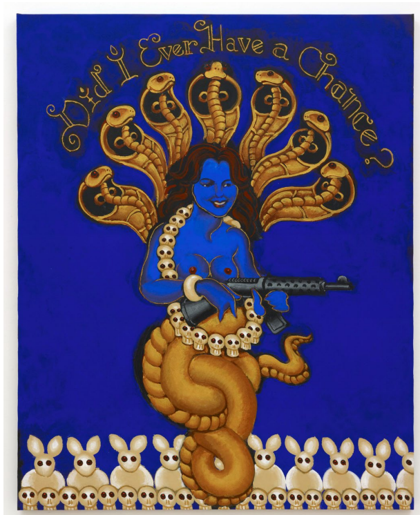
¿Alguna vez tuve una oportunidad? , 1999 Acrílico sobre lienzo