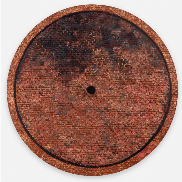
Cielo , 1988 Acrílico sobre lienzo Cortesía de The Martin Wong Foundation y P.P.O.W, Nueva York Colección KAWS