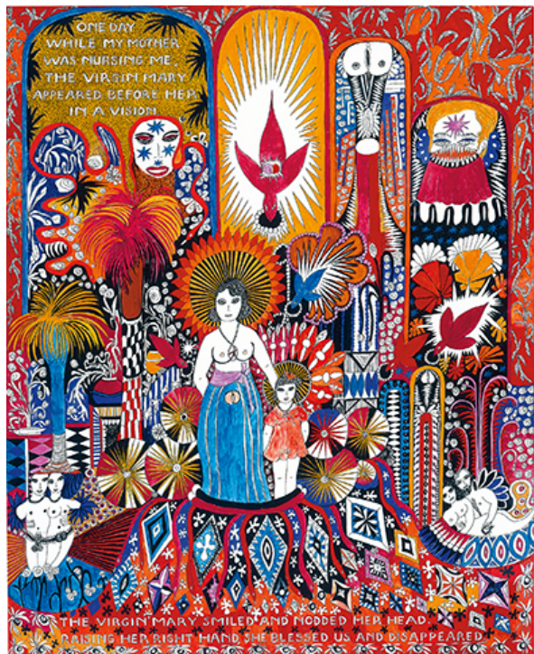
Dorothy Iannone, Story of Bern [Historia de Berna] , 1970.