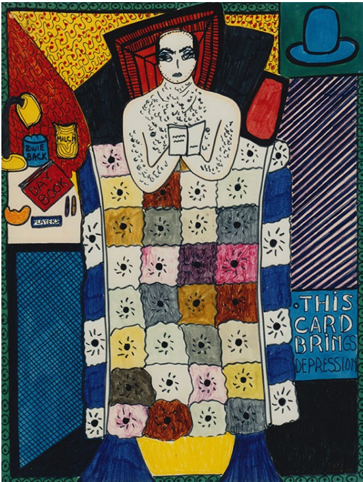
Dorothy Iannone, (Ta)Rot Pack , 1968-69 / 2009.