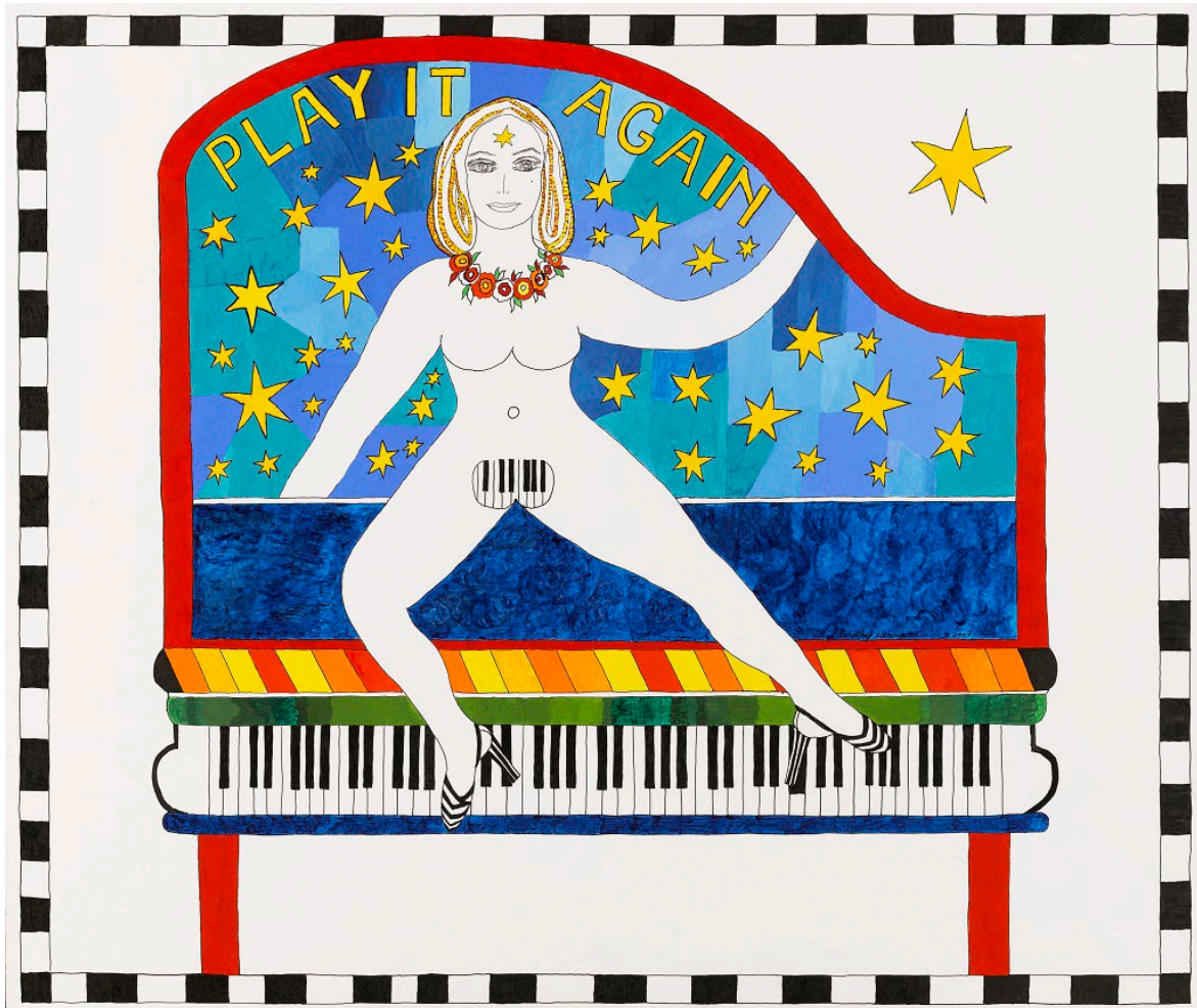
Imagen: Dorothy Iannone, Play It Again , 2007.