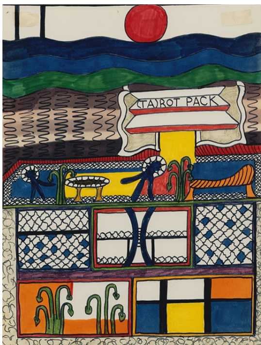
Dorothy Iannone, (Ta)Rot Pack , 1968-69 / 2009.