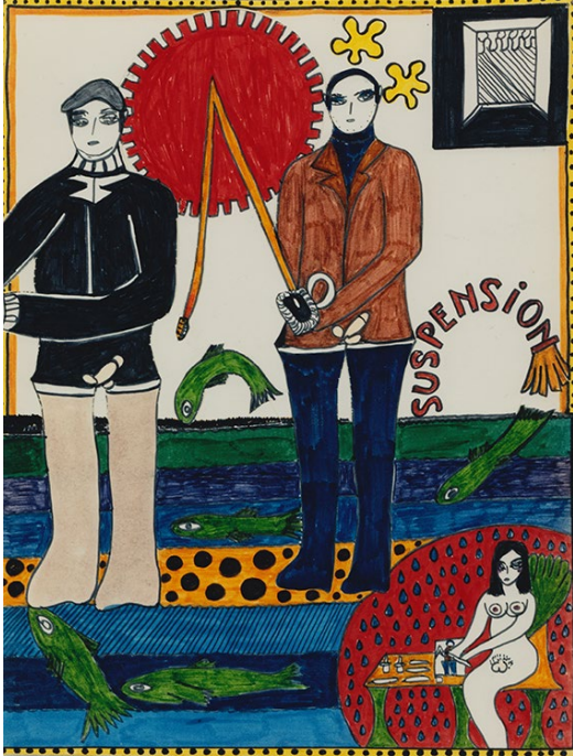
Dorothy Iannone, (Ta)Rot Pack , 1968-69 / 2009.