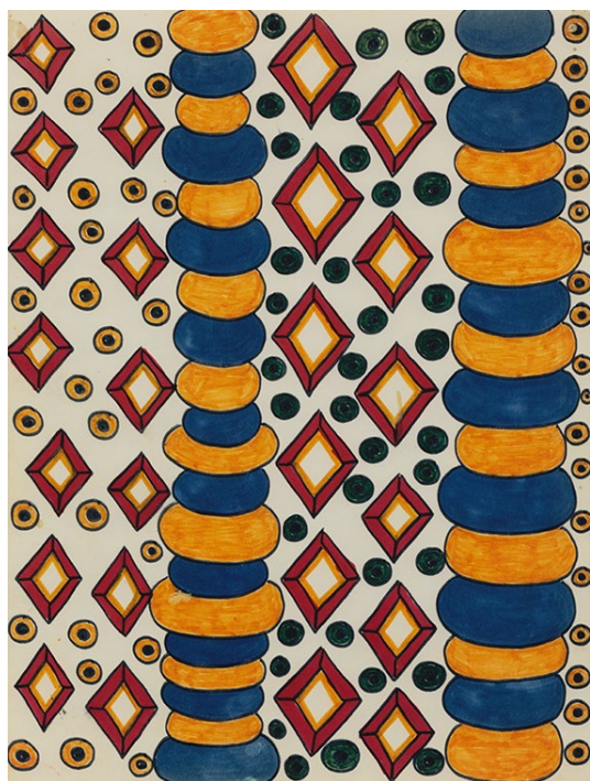
Dorothy Iannone, (Ta)Rot Pack , 1968-69 / 2009. Cortesía de Air de Paris, Romainville / Grand Paris