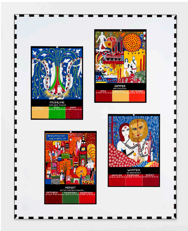
Dorothy Iannone, Always Alluring [Siempre seductora], 1980-2019.