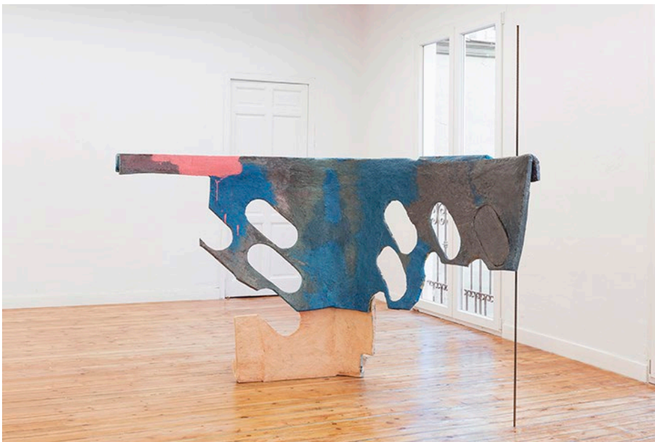
Façana (Baskets) , 2021 Cartón, tela, Fast Maché, pintura acrílica, madera, barra de hierro, esponjas y trapos de cocina, barniz. 200 x 160 x 150 cm. Colección Museo CA2M