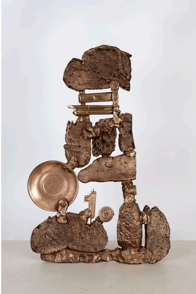
Construcción II (plato) , 2025 Bronce y cera. 38,5x58,5x5cm.