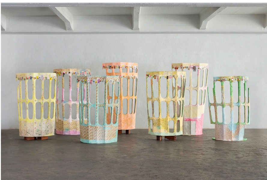
The Artist Is the Garden , 2025 Cartón, madera, FastMaché, tela, acuarela, pintura acrílica y de aerosol, recortes varios (envases, bolsas, pegatinas, etiquetas, revistas) cinta adhesiva y ladrillos. Dimensiones variables.