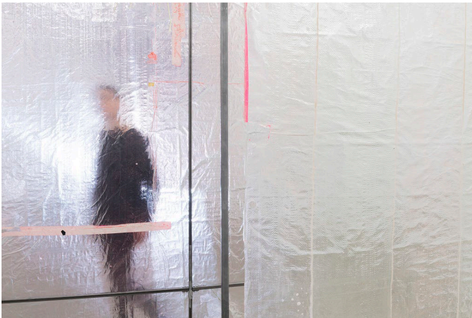
Detalle de The Passerby , 2015 Vaciado de resina de poliuretano, pigmentos y cinta adhesiva Dimensiones variables