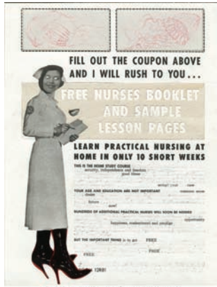
ELLEN GALLAGHER Free Nurses from DeLuxe, 2004 - 2005 A portfolio of 60 stichings with photogramme, spiltite, collage, laser cutting, laser peeling, silkscreen, offset lithography, handpainted and plasticine sculptural additions. 84 1/4 x 175 inches / 214 x 444.5 cm (framed) Edition 10/20 GALLA 2004.0031 Detail