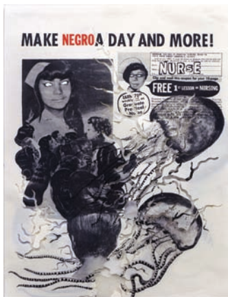
ELLEN GALLAGHER Negro a Day and More! from DeLuxe, 2004 - 2005 A portfolio of 60 stichings with photogramme, spiltite, collage, laser cutting, laser peeling, silkscreen, offset lithography, handpainted and plasticine sculptural additions. 84 1/4 x 175 inches / 214 x 444.5 cm (framed) Edition 10/20 GALLA 2004.0031 Detail

Colección Larry Gagosian Cortesía del artista, Gagosian, Nueva York, and Hauser & Wirth, Nueva York