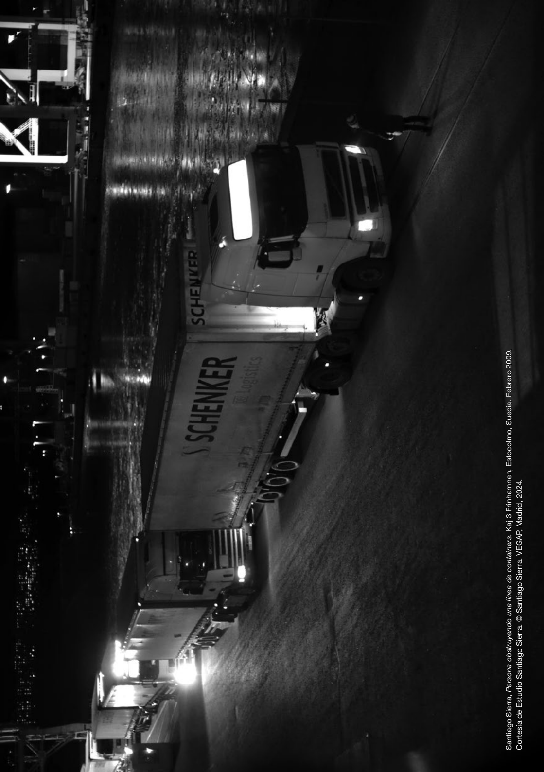
Santiago Sierra, Persona obstruyendo una línea de contáiners . Kaj 3 Finnhammen, Estocolmo, Suecia, Febrero 2009.