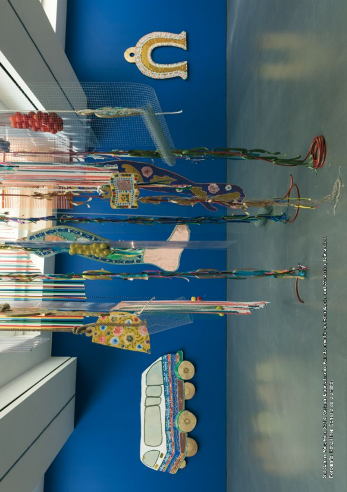
Soji Galero, Pica Pica , 2018. Vista de la instalación. Kunstverein für die Rheinlande und Westfalen, Düsseldorf.