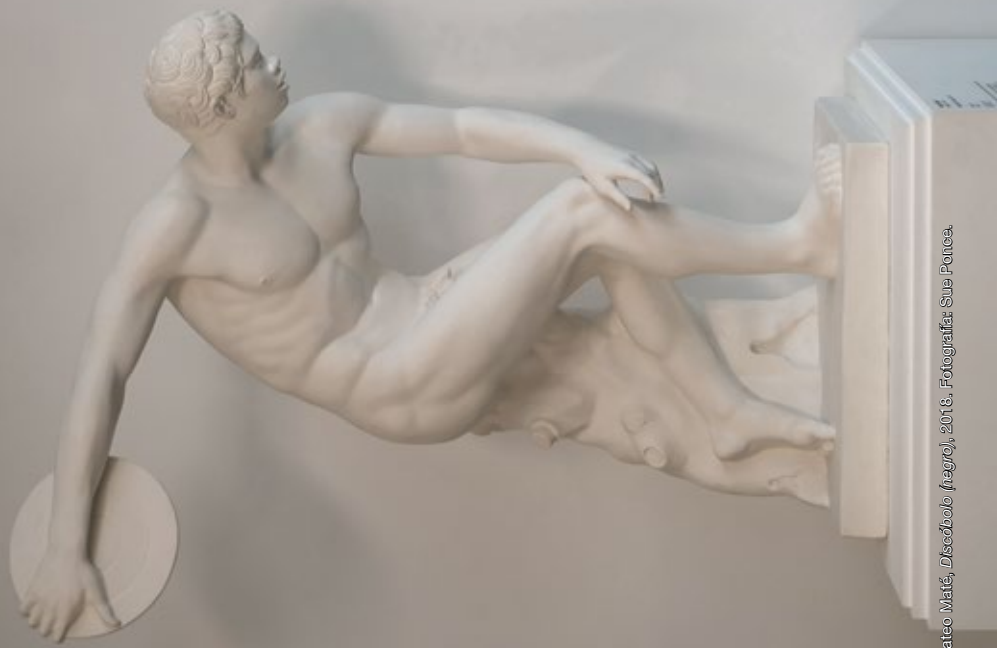
Mateo Maté, Discóbolo (negro) , 2018.