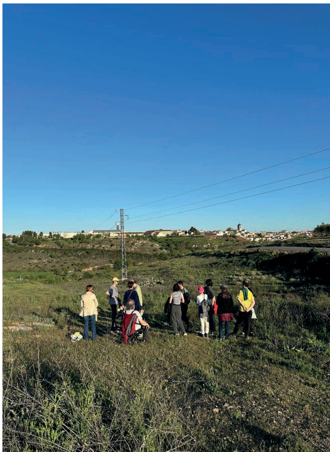
Grupo de Universidad Popular en Polo inaccesible. Abril 2025