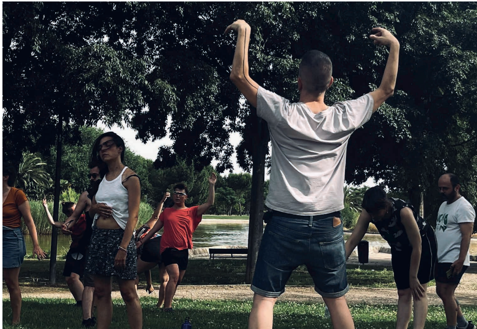
Fotografía: Miren Muñoz Vitoria, "El permiso" Rojo pandereta

HASTA JUNIO SÁBADOS ALTERNOS 11:00 — 14:00