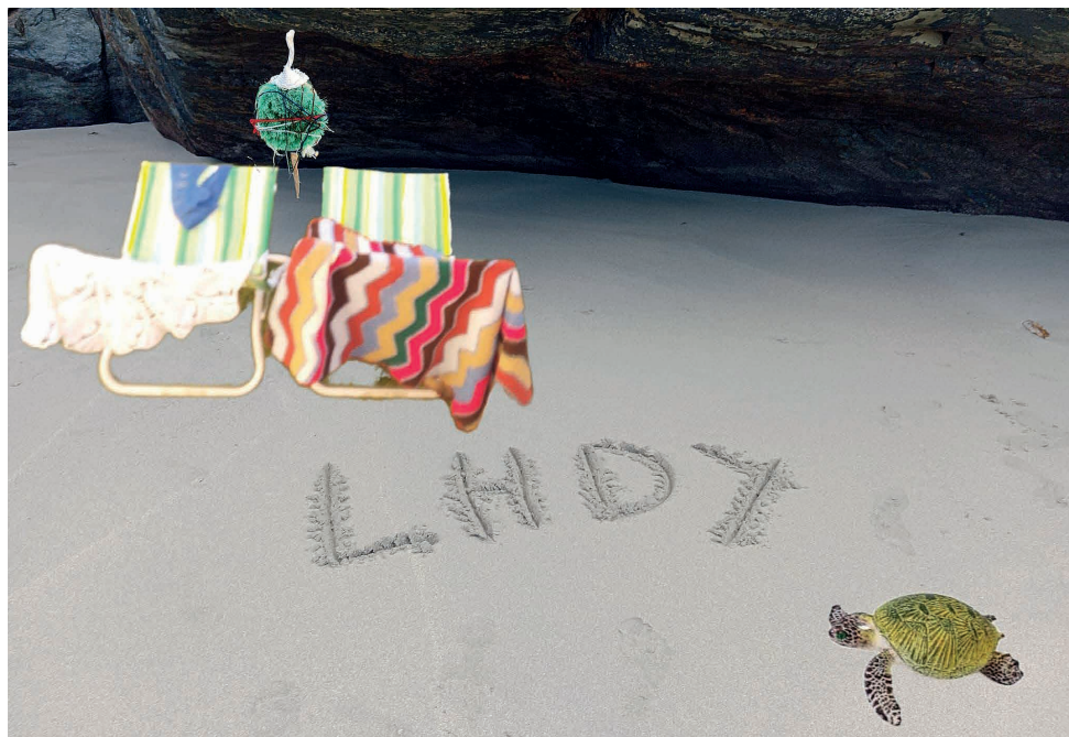
Imagen: Las Hijas de Yocasta

HASTA JUNIO JUEVES ALTERNOS 17:00 — 20:00